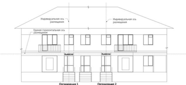
Расположение нескольких вывесок

УПРАВЛЕНИЕ СТРОИТЕЛЬСТВА И АРХИТЕКТУРЫ АДМИНИСТРАЦИИ ЧУСОВСКОГО ГОРОДСКОГО ОКРУГА